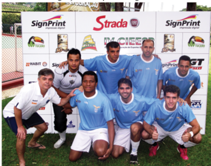
Time campeão do Futsal 2011