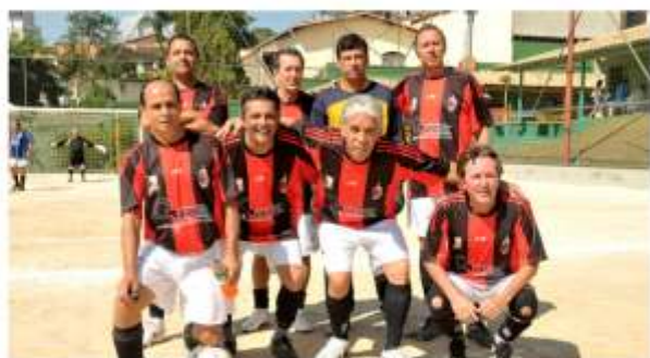
Especial CAMPEÃO - Milan