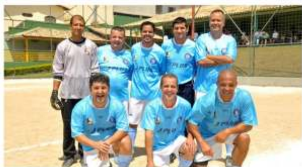
Sênior CAMPEÃO - Nápoli