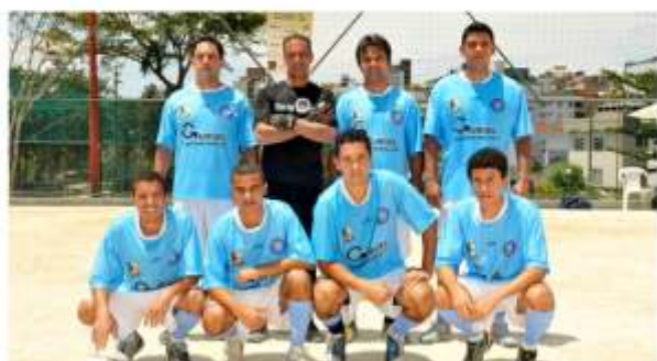
Máster CAMPEÃO - Nápoli