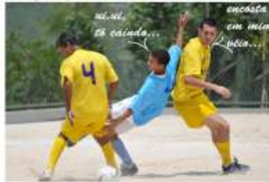
Amigo é pra essas horas...