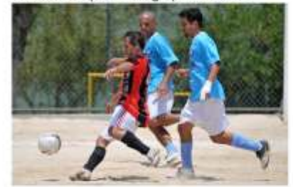
Vamos ver quem chega primeiro...