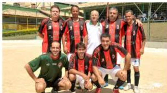
Sênior VICE-CAMPEÃO - Milan