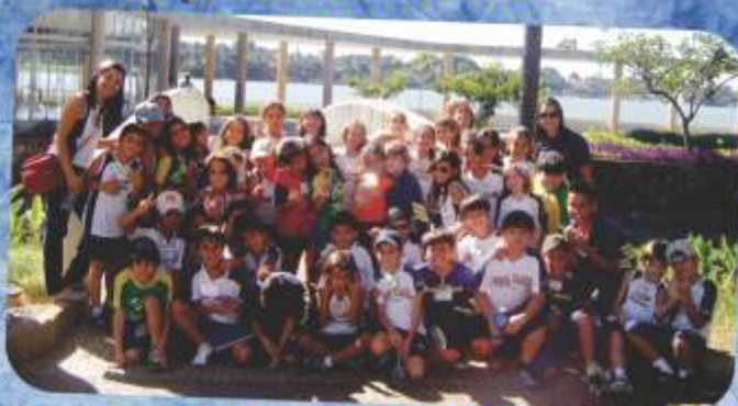
Ensino de Qualidade e Responsabilidade