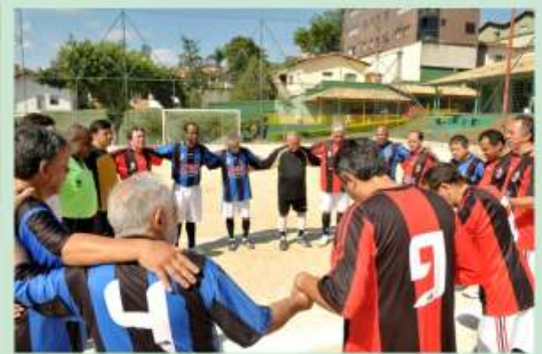
A fé acima de tudo...