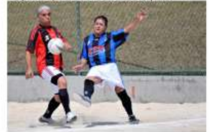
O que é que eu tô fazendo aqui???