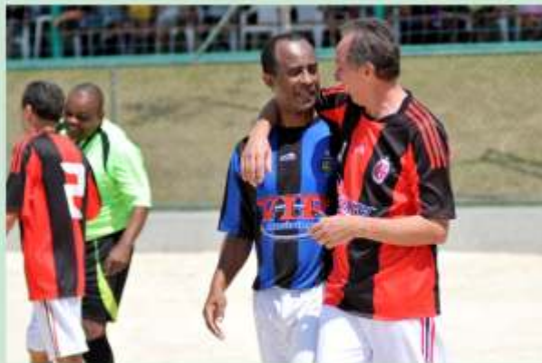
A competição acaba mas a amizade permanece.