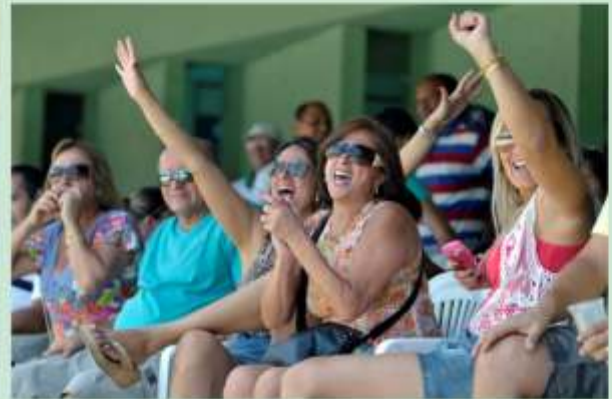
Torcida presenciou e apoiou muiiiito.