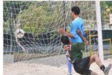
Por favor, não faça isso...snif, snif, snif...