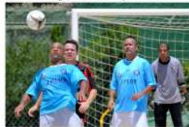
Quando ninguém sabe o que fazer...