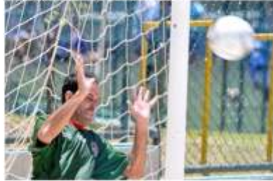
lxl, essa nem quero ver...