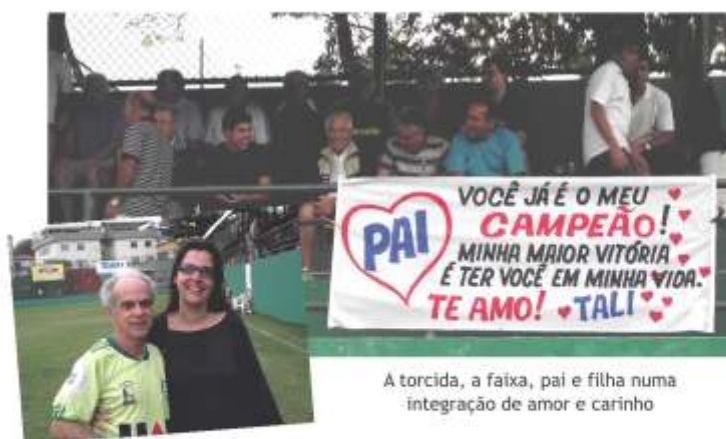
A torcida, a faixa, pai e filha numa integração de amor e carinho

o corpo e para a mente, sempre andei muito. Quando adolescente, eu ia a pé de casa para o trabalho e voltava também. Morava na Cachoeirinha e trabalhava no Centro”.