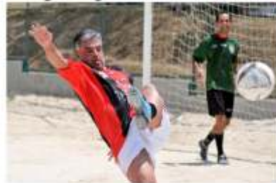
Me seguura geeeente!