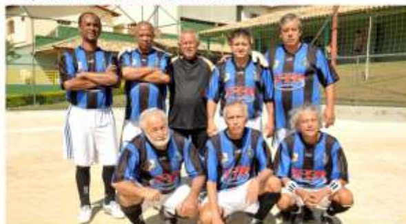
Especial VICE-CAMPEÃO - Internazionale