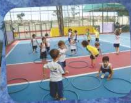
Escola de Esportes