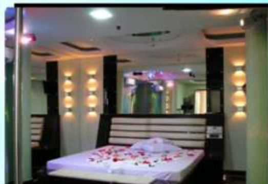
Suíte GT MASTER