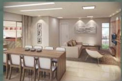
SALA DE ESTAR / JANTAR